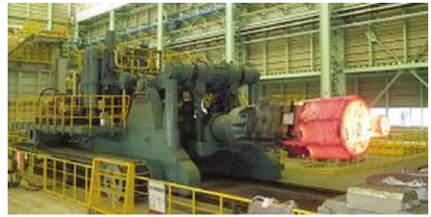
図3 30T/80T・Mマニピュレーター