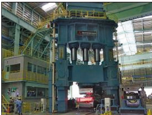
図2 5000T鍛造プレス外観

各種産業機器、発電設備、船舶・航空・鉄道などの輸送機に用いられる大径特殊鋼鋼材やそれらを加工するための金型および金型周辺部品に使用する大型工具鋼に対する需要に応える為、5000T鍛造プレスを導入し、2011年10月より量産稼働を行っている。図2に5000T鍛造プレスの外観写真を示す。当社の5000T鍛造プレスは、メンテナンス性を考慮し、可動部分が地上に出ているプッシュダウン式プレスであり、機体上部に装備した3本の1700T油圧シリンダーの伸縮により上金敷を上下させて鍛造を行う。3本のシリンダーは使用本数を変化させることが可能であり、圧鍛する鋼材の変形抵抗に応じてプレス出力を選択することで効率的な鍛造を実施している。5000T鍛造プレスの最大出力（鍛造力）は50MNであり、これにより難加工鋼種の据込み（鋼塊を上下方向に圧鍛し径方向寸法を大きくする作業）の可能範囲が拡大され、鍛錬成形比（鋼塊と製品の断面積比率:数値が大きいほど鍛錬が効いている指標）の向上を可能にした。また、5000T鍛造プレスの導入に際し、可搬能力:最大30t、保持可能なモーメント:80T・Mのマニピュレーター（図3）を採用した。既存設備よりもトルクアップしたマニピュレーターにより、大断面かつ長尺の鋼材を安定して保持することが可能となった。5000T鍛造プレスと30T/80T・Mマニピュレーターにより、製造可能範囲は表2に示すように丸棒鋼では従来のφ740mmからφ1050mmに、平角鋼では幅寸法1050mmから1500mmに拡大した。（鋼種により製造可能寸法は異なる。）