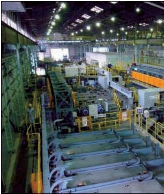
図3 Eブロンライン工場外観