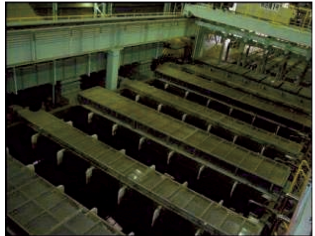
図4 自動酸洗設備外観

また各硫酸槽にはプッシュ・プル方式の局所排気装置を設け、酸洗で生じる酸の蒸気の拡散を抑えている。