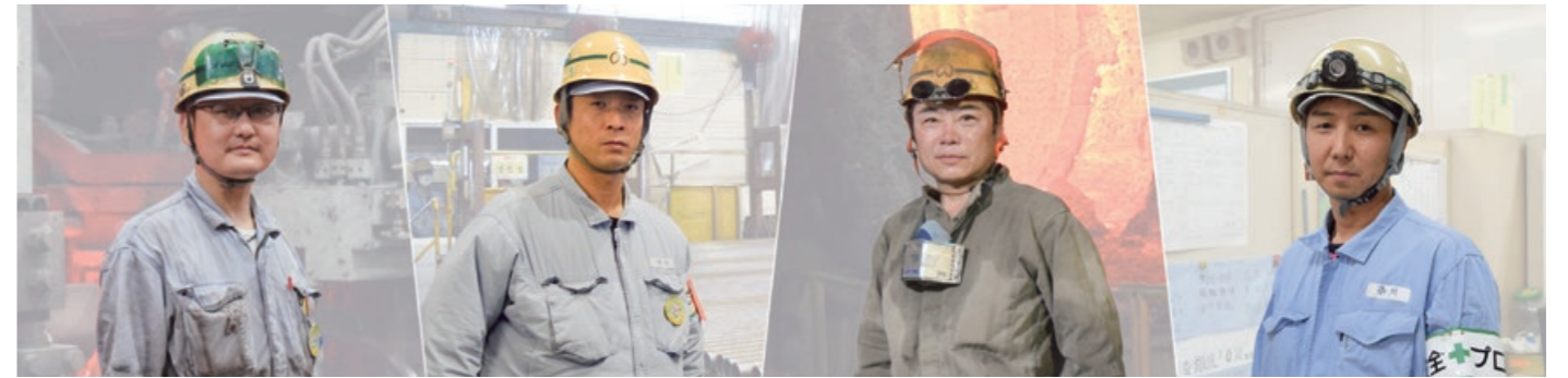
各職場から選抜された「安全プロ」