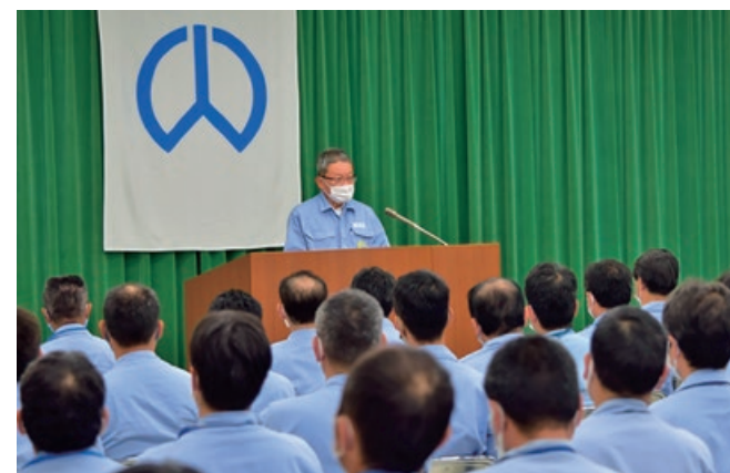
経営トップによるメッセージの発信

当社は、今後もこれらの活動を継続することで、より高い倫理観の涵養に努め、当社のみならず当社グループ全体の経営の健全性の維持・向上を図るとともに、高い倫理観に根ざした事業活動を推進することにより、「事業を通じて社会貢献を果たす」という企業の使命を実践してまいります。