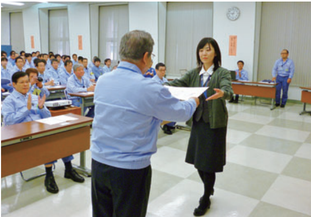
2013年度品質標語 表彰式