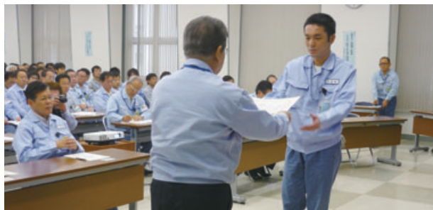
2012年度品質標語 表彰式