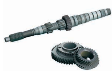
自動車用ギア・シャフト

ECOMAX鋼は、CO 2 排出量削減のための自動車駆動系部品の小型・軽量化ニーズに対応するもので、自動車のギアやシャフトをはじめとする高い強度が求められる部品の素材として期待されています。